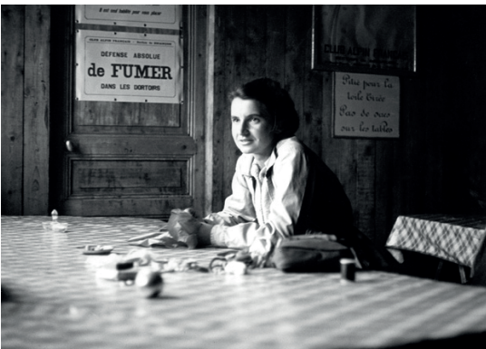
• Rosalind Franklin