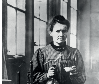
• Marie Curie