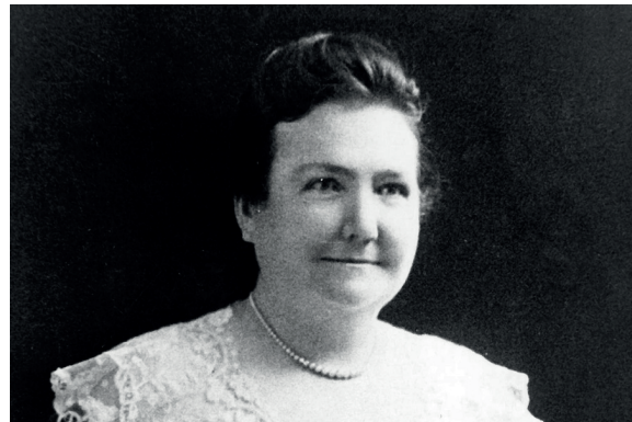
• Cecilia Grierson